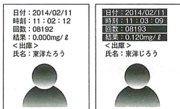
写真付き検査結果出力